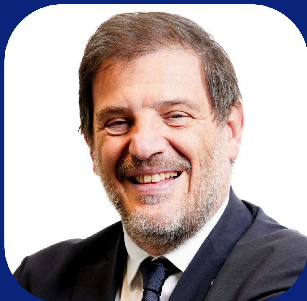
Florian GRILL Président de la FFR

Le rugby français entre aujourd'hui dans un nouveau cycle. Cette nouvelle convention marque une étape déterminante et traduit une volonté claire : avancer ensemble, avec lucidité et ambition, au service de l'intérêt général du rugby.