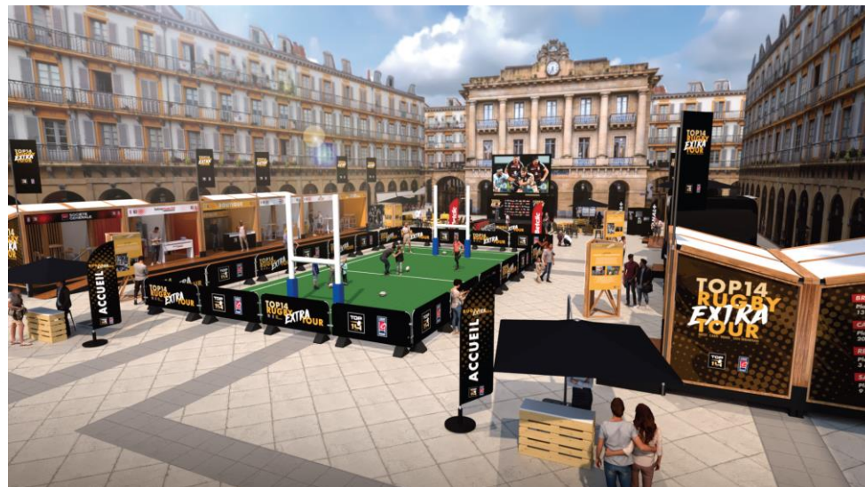
Schéma non contractuel